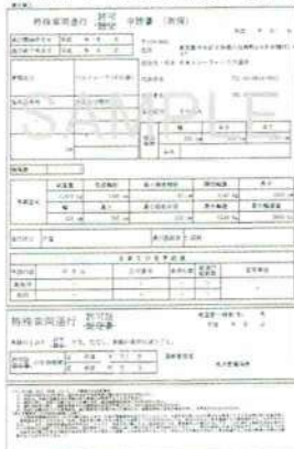
特殊車両通行許可書